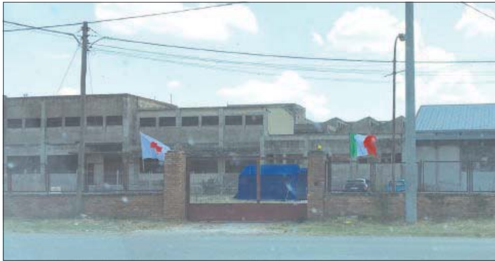
L'ex tabacchificio di Palazzo

PALAZZO S. G. - Anche se con qualche ritardo, il campo di accoglienza nell'ex tabacchificio di Palazzo San Gervasio aprirà presto i battenti. La Regione Basilicata ha infatti pubblicato il bando per per individuare il gestore. «Una buona notizia - spiega Pietro Simonetti del Tavolo nazionale anticaporalato del Ministero del Lavoro - dopo il superamento delle resistenze opposte del Comune interessato che continua a bloccare la costruzione di un moderno centro progettato dalla Regione nel 2017 e finanziato dal Ministero dell'interno con 4 milioni di euro del Pon Legatità». «Ricordiamo - aggiunge - che negli ultimi cinque anni nel sito dell'ex tabacchificio, di proprietà Regionale, sono stati ospitati circa 2000 persone, mentre nell'area Bradano sono stati assunti cinquemila stagionali, eliminato il ghetto di Boreano, realizzato il servizio di trasporto a chiamata con la sperimentazione 2017/18 istituiti le