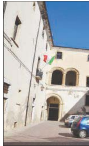
Il comune di Lavello

LAVELLO - La comunità di Lavello si lecca le ferite dopo l'incendio di lunedì che ha distrutto molta vegetazione nella zona di Vallecupa. Sulla questione è intervenuto in una nota l'amministrazione comunale di Lavello. «Durante il periodo estivo, da tutti vissuto come un momento di vacanza, di ferie, di rallentamento dalle frenetiche attività lavorative, c'è chi, al contrario, è chiamato ad un impegno straordinario a tutela e salvaguardia del nostro territorio e della nostra incolumità. Un lavoro spesso dato per scontato, quasi mai al centro dell'attenzione dei media». E riferendosi in particolare all'incendio di Vallecupa dove «diverse squadre dei Vigili del Fuoco, sopraggiunte sul posto man mano che terminavano altri interventi analoghi in altre zone, senza un attimo di riposo» sono riuscite «a mettere in sicurezza il fronte del fuoco e a domare le fiamme» è da sottolineare «il tentativo eroico di un pompiere di salvare dall'in-