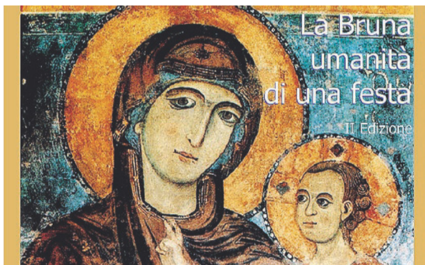
LA SACRA IMMAGINE L'affresco di Maria Santissima della Bruna